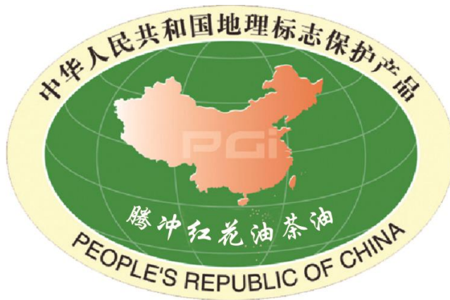
图1：腾冲红花油茶油地理标志保护产品专用标志

腾冲红花油茶油地理标志保护产品专用标志见图1。标志的轮廓为椭圆形，淡黄色外圈，绿色底色。椭圆内圈中均匀分布四条经线、五条纬线，椭圆中央为中华人民共和国地图。在外圈上部标注“中华人民共和国地理标志保护产品”字样；中华人民共和国地图中央标注“PGI”字样；在外圈下部标注“PEOPLE’S REPUBLIC OF CHINA”字样。在椭圆形第四条和第五条纬线之间中部标注受保护的地理标志产品名称，即“腾冲红花油茶油”。